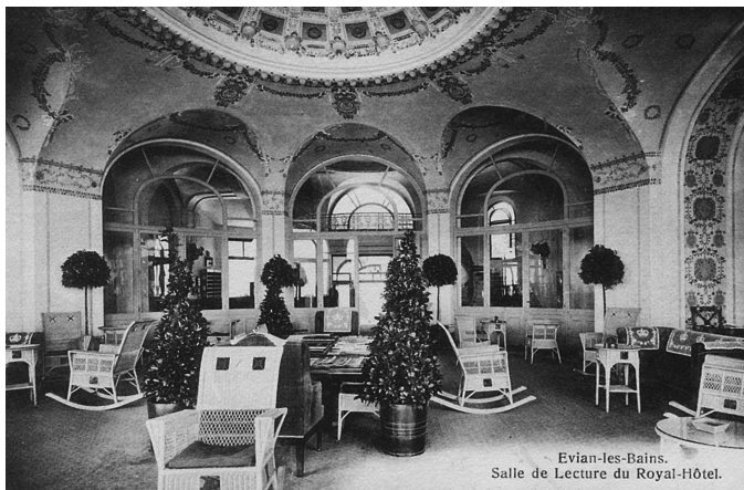
Evian-les-Bains. Salle de Lecture du Royal-Hôtel.